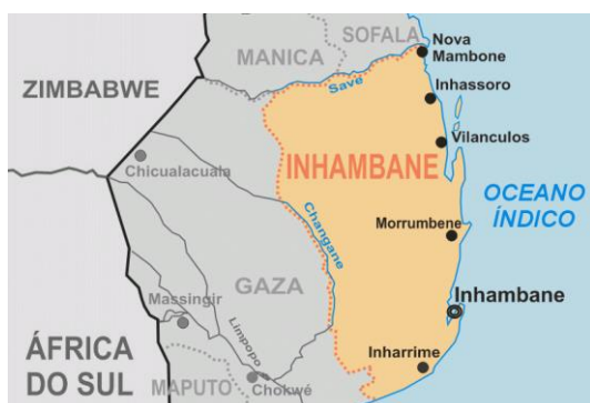
Ilustración 2: Mapa de la provincia de Inhambane

El estudio de base se pensó para ser realizado en cuatro distritos (Panda, Funhalouro, Govuru e Inhambane), escogidos estos como una representación territorial de la provincia de Inhambane. Tenemos a Panda como lugar más al sur de la provincia, Funhalouro como punto interior, Govuru como lugar más al norte y en el centro y con la vertiente de ciudad capital, a Inhambane. También, a la hora de escoger los distritos se tuvo en cuenta la presencia de la UNAC en el territorio y el grado de conflictividad del mismo. No se acabó utilizando ninguna técnica ya que solo mediante las cuestiones prácticas quedaron definidos los diferentes distritos donde se realizó el estudio.